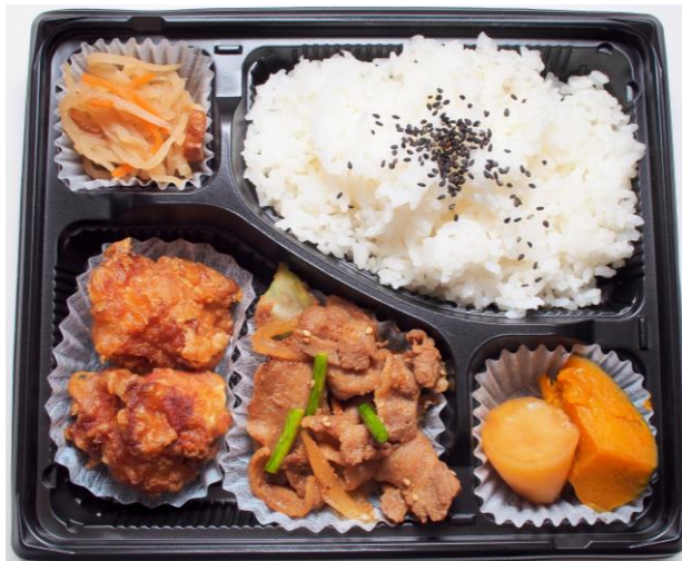
※盛り付けイメージ

以降はパークゴルフ（プレー・レンタル）料金500円を除いた 全額 のご負担となります。