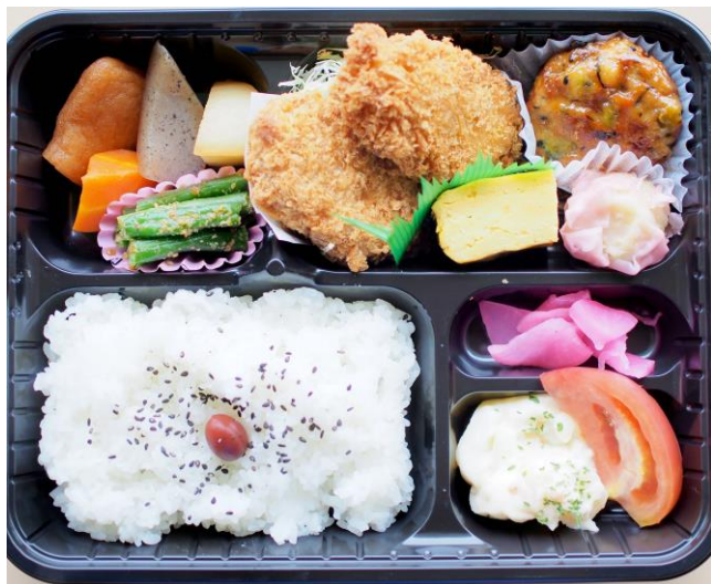
※盛り付けイメージ(内容は日替わりです)

※15名以上から承ります。カフェ・レストラン「ニツ沼」の定休日（月曜・火曜）はご利用いただけません。 ご予約は2週間前までをお願いします。7日前までのキャンセルは無料。 以降はパークゴルフ（プレー・レンタル）料金500円を除いた全額のご負担となります。