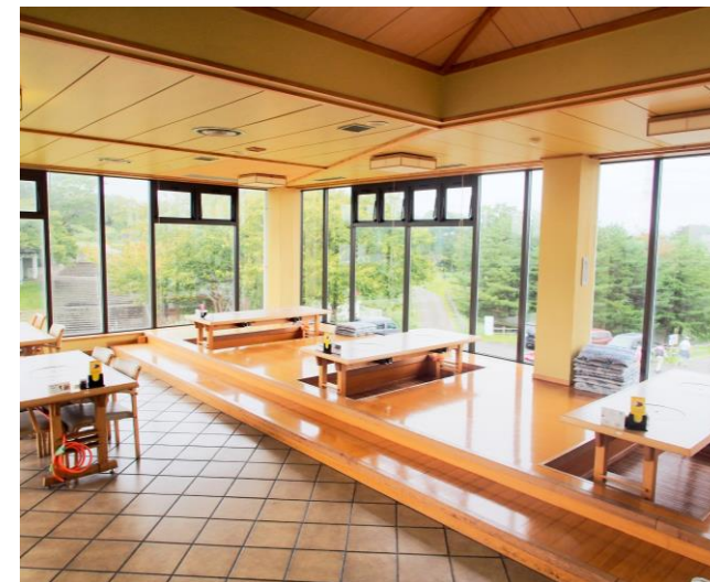
カフェ・レストラン「ニツ沼」店内